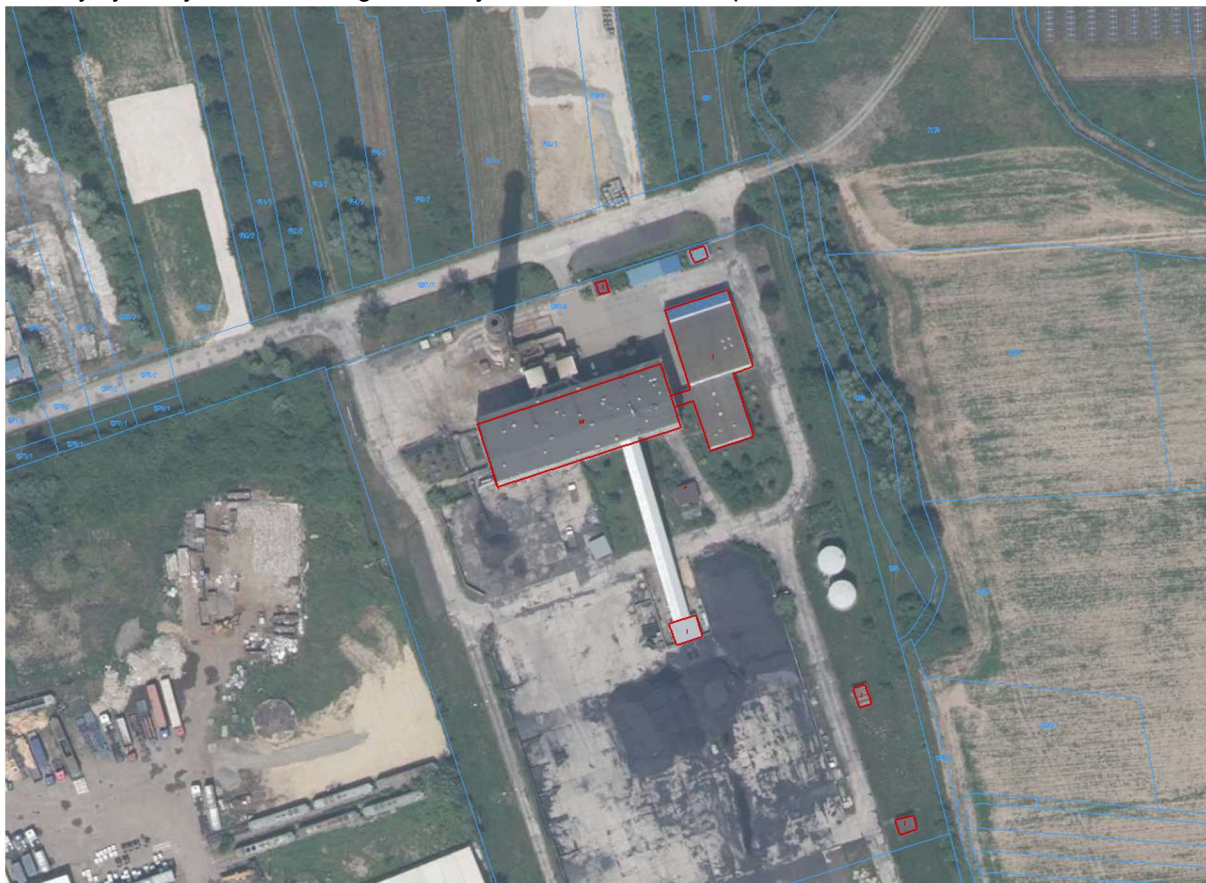
Rysunek 1. Planowany teren inwestycji – dz. nr 1387/8

Planowana inwestycja zostanie zlokalizowana na działce o nr 1387/8 obręb 0001 w mieście Brzesko. Na działce zlokalizowana jest aktualnie hala przemysłowa w której znajdują się kotły węglowe Ciepłowni MPEC Brzesko Sp. z o.o.. Tytuł prawny do działki 1387/8 posiada Gmina Brzesko. Wieczystym użytkownikiem tego terenu jest MPEC Brzesko Sp. z o.o.