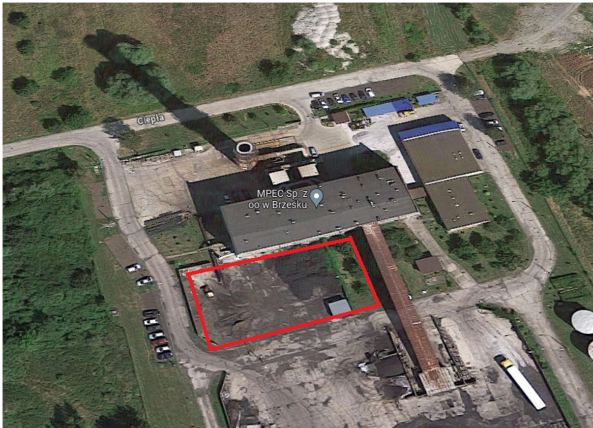
Rysunek 3. Proponowana lokalizacja planowanych obiektów budowlanych do wykonania w ramach inwestycji.

Obecnie na działce o nr 1387/8 w mieście Brzesko znajduje się kotłownia węglowa, wraz z infrastrukturą towarzyszącą. Wokół kotłowni znajdują się drogi wewnętrzne tworzące spójny układ komunikacyjny. Od strony południowej budynku kotłowni znajduje się plac węglowy. Od strony zachodniej ściany budynku kotłowni znajdują się instalacja odzulfiania kotłów WR-25, a od strony ściany północnej instalacja odpylania spalin wraz z kominem.