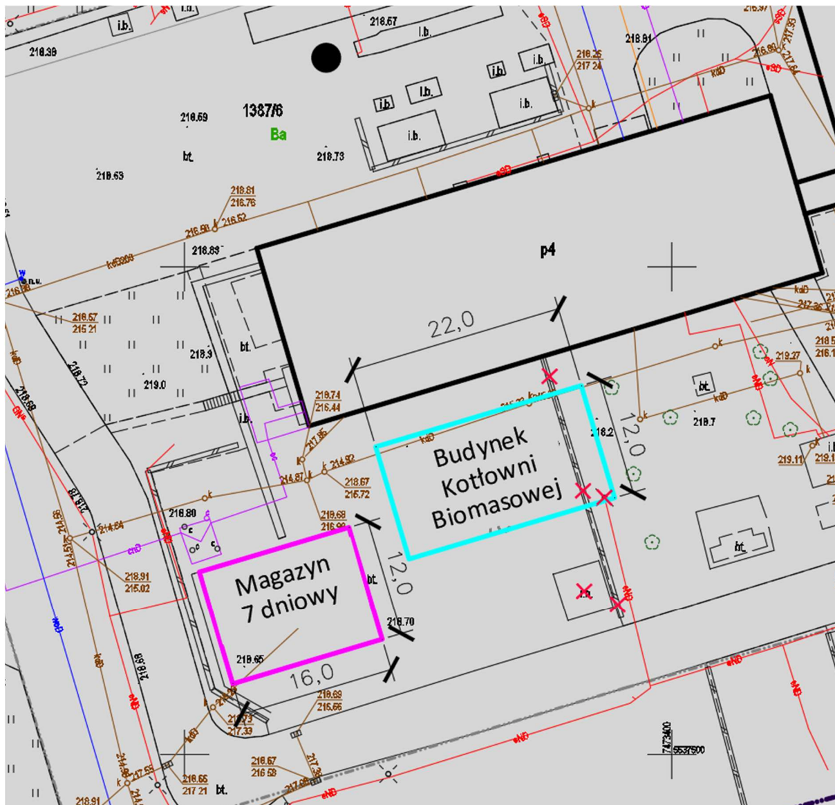
Rysunek 2. Proponowany plan zagospodarowania obiektów budowlanych planowanych w ramach inwestycji