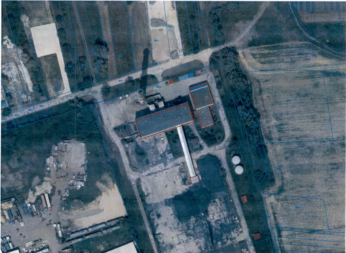
Rysunek 1. Planowany teren inwestycji – dz. nr 1387/8

Planowana inwestycja zostanie zlokalizowana na działce o nr 1387/8 obręb 0001 w mieście Brzesko. Na działce zlokalizowana jest aktualnie hala przemysłowa w której znajdują się kotły węglowe Ciepłowni MPEC Brzesko Sp. z o.o.. Tytuł prawny do działki 1387/8 posiada Gmina Brzesko. Wieczystym użytkownikiem tego terenu jest MPEC Brzesko Sp. z o.o.