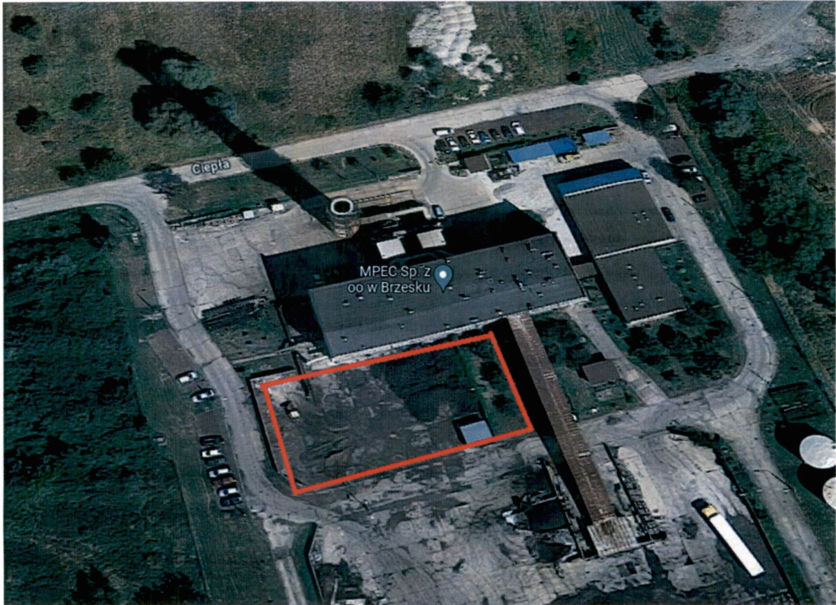
Rysunek 3. Proponowana lokalizacja planowanych obiektów budowlanych do wykonania w ramach inwestycji.

Obecnie na działce o nr 1387/8 w mieście Brzesko znajduje się kotłownia węglowa, wraz z infrastrukturą towarzyszącą. Wokół kotłowni znajdują się drogi wewnętrzne tworzące spójny układ komunikacyjny. Od strony południowej budynku kotłowni znajduje się plac węglowy. Od strony zachodniej ściany budynku kotłowni znajduje się instalacja odzulfiania kotłów WR-25, a od strony ściany północnej instalacja odpylania spalin wraz z kominem.